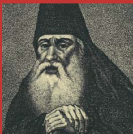
Symeon of Polotsk